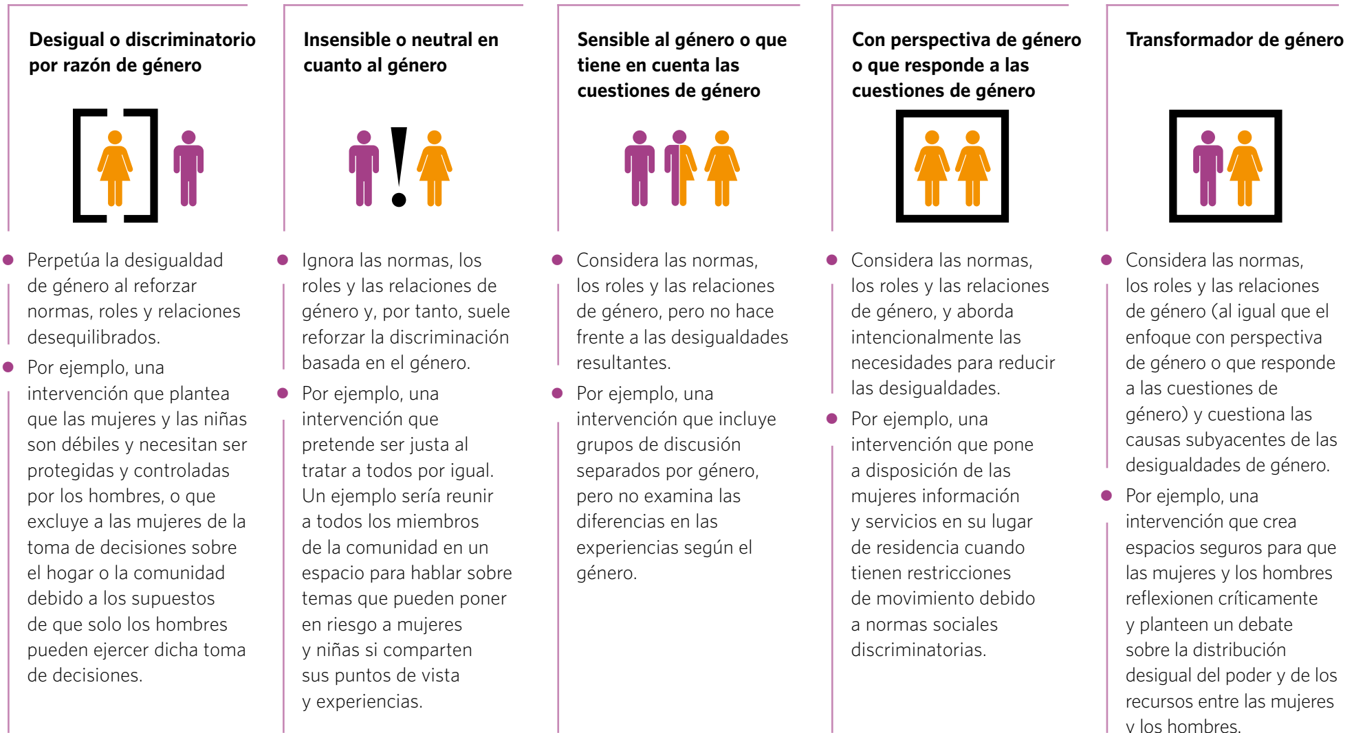
GRÁFICO 1. EL CONTINUO DE LA INTEGRACIÓN DE GÉNERO