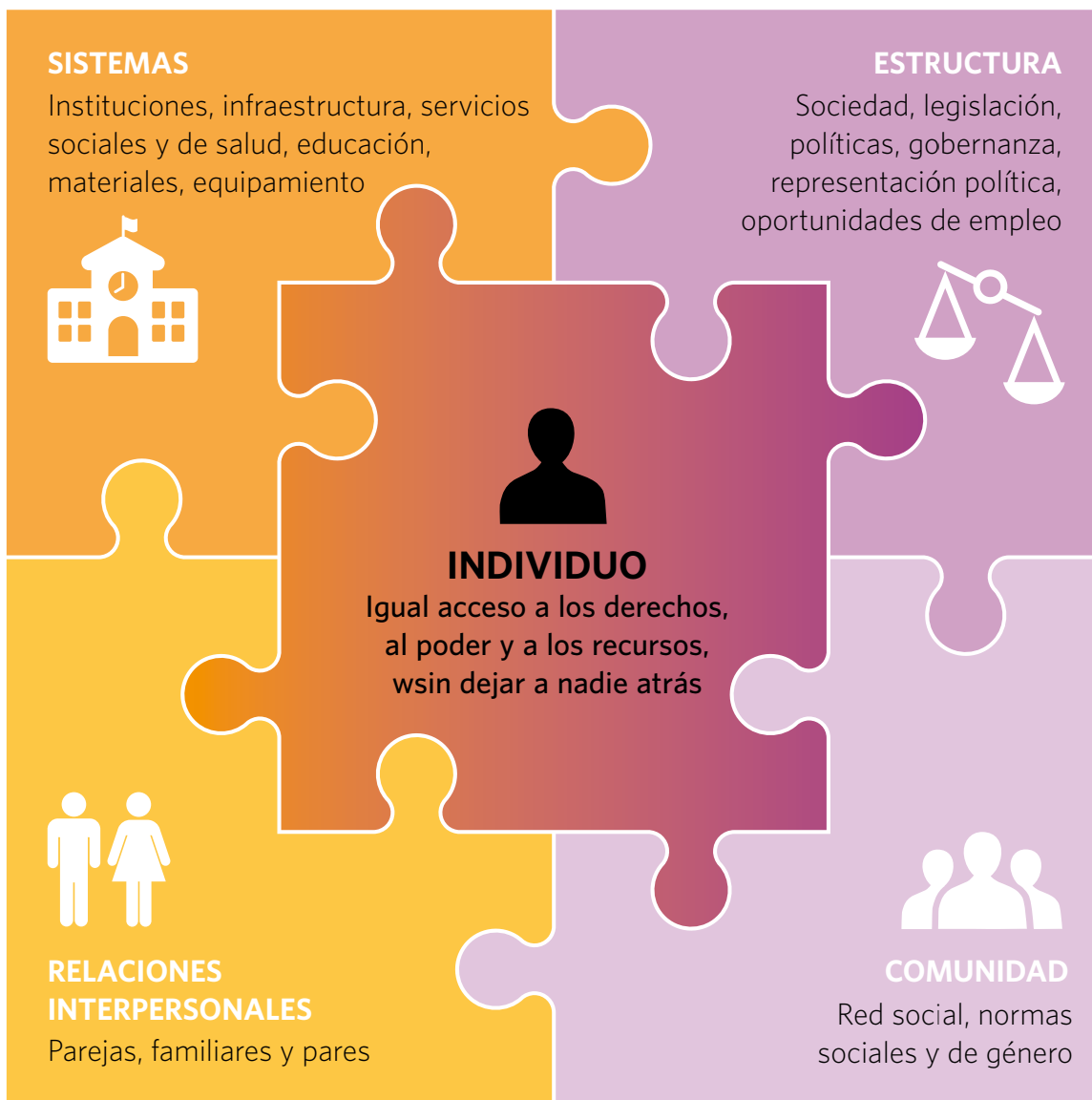
GRÁFICO 2. MARCO CONCEPTUAL DE LA PROGRAMACIÓN TRANSFORMADORA DE GÉNERO